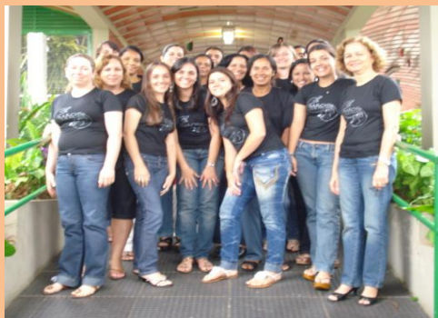
Grupo de Alunos do Curso de Libras Cidade: Patrocínio