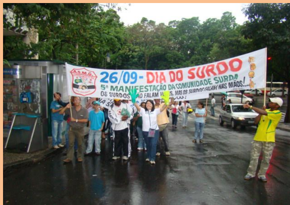
Passeata do Dia dos Surdos em Belo Horizonte