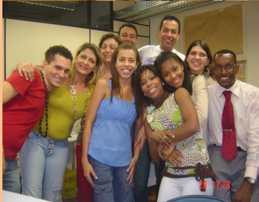
Convênio SEMAD Funcionários Surdos Turma da Tarde