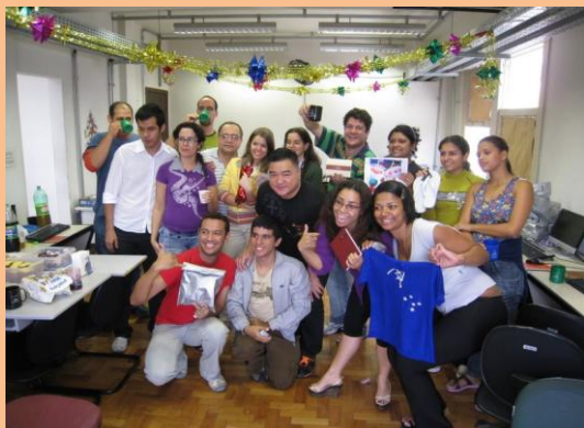
Convênio SEMAD Confraternização: Amigo Oculto Turma da Manhã