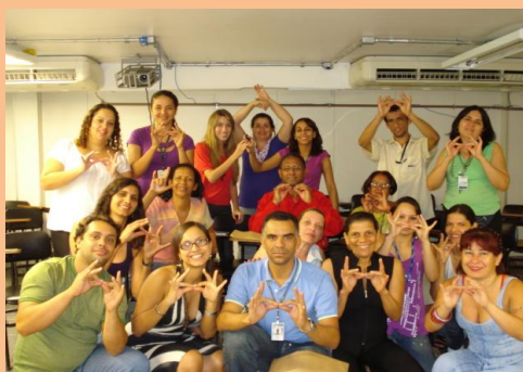
Grupo de Alunos da Oficina de Libras Convênio: IPSEMG