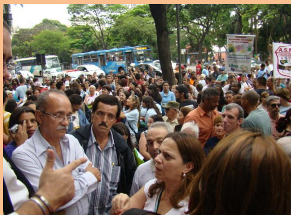
Passeata do Dia dos Surdos em Belo Horizonte