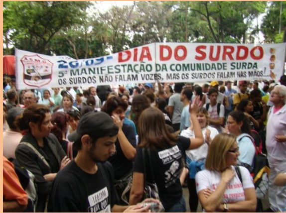
Passeata do Dia dos Surdos em Belo Horizonte – Minas Gerais