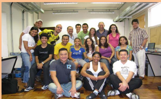
Convênio SEMAD Funcionários Surdos Turma da manhã