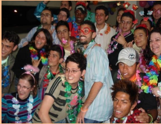
Convênio TRT Funcionários Surdos na Confraternização do Dia dos Surdos