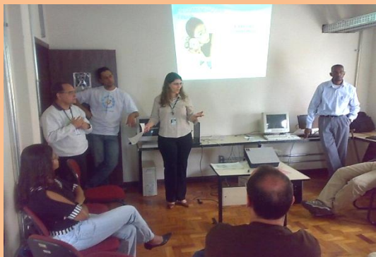
Convênio SEMAD Orientação de Funcionamento do Trabalho. Palestra para os surdos.