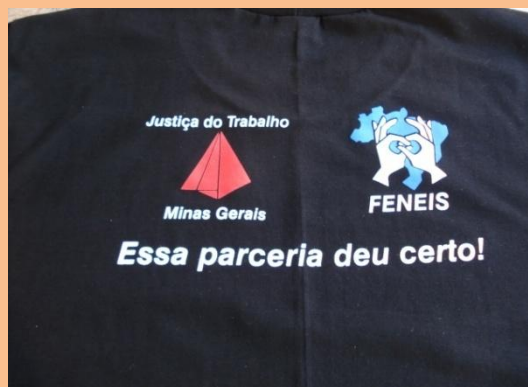
Camisa do Dia dos Surdos VERSO