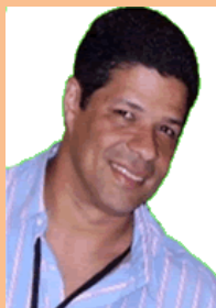
Diretor Primeiro Vice-Presidente