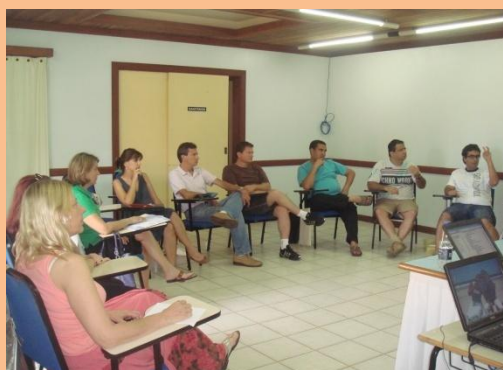
Reunião dos Diretores da Feneis em Florianópolis - Santa Catarina