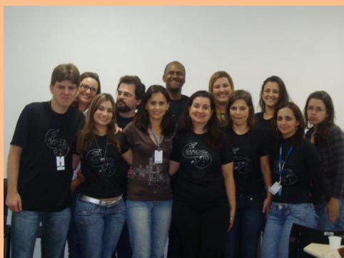
Grupo de Alunos da Oficina de Libras Convênio: Fio Cruz