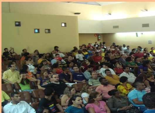
Funcionários Surdos nas Palestras ministradas pela Presidente e pelos Diretores da Feneis