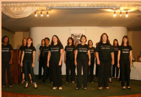
Grupo de Alunos do Curso de Libras Cidade: Pará de Minas